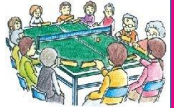
卓球バレーのイメージ

【第3回】 「人生会議」を体験しよう - 「もしバナ」ゲームを通して人生の最終章を考える - 12月4日（水）10:00～11:30