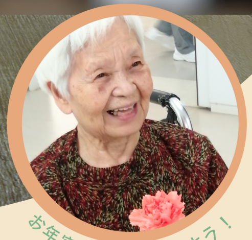
お年寄りとお話をしよう!

高校生の皆さんと旭川荘厚生専門学院（介護福祉学科）の学生と一緒に、おじいちゃん・おばあちゃんに笑顔になってもらう企画です。相手に感動を与えて自分も感動できる、そんなボランティア活動を目指しています。「人の役に立ちたい」気持ちを活かしてチャレンジしてみませんか！