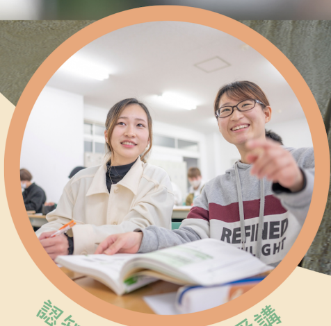
認知症サポーター受講

おじいちゃん・おばあちゃんに 笑顔になってもらいたい！ 「人の役に立ちたい」想いを叶えてみませんか？