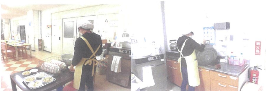
朝食 夕食の配膳作業