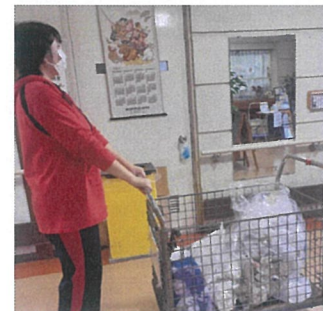
休日のごみ集め作業